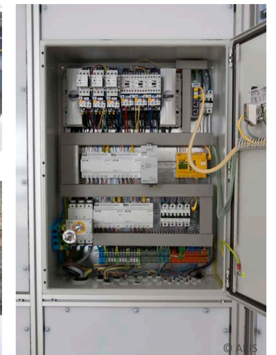
Schaltschrank, Firmenpark Frickenhausen