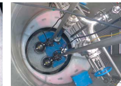
Externe Hebeanlage, Gackebach