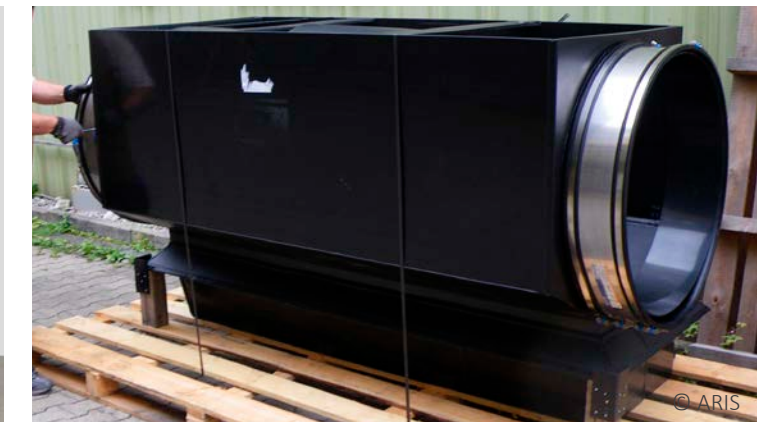
LUPO-Filter, TESCO Avenmouth, Großbritannien