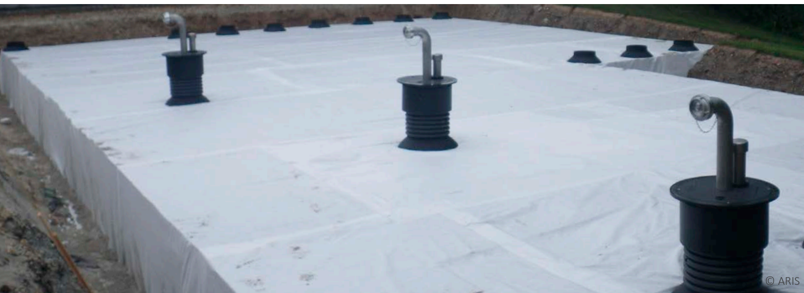
Löschwasserbevorratung nach DIN 14230 (2012), Evoqua Günzburg