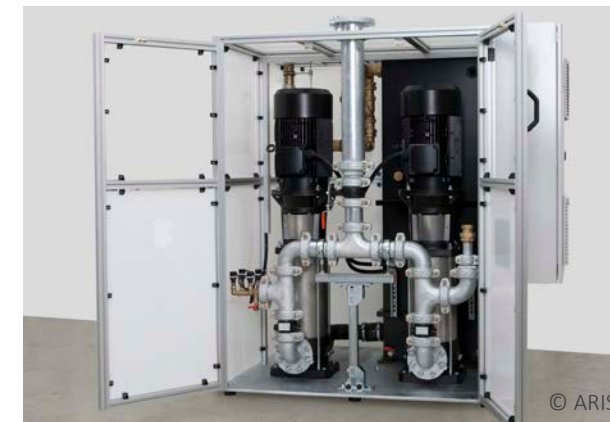
Löschwassertrennstation, Marienhospital Stuttgart