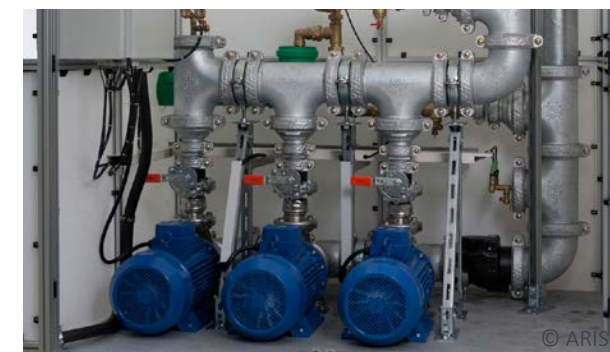
Druckerhöhungsanlage, Rechenzentrum Frankfurt