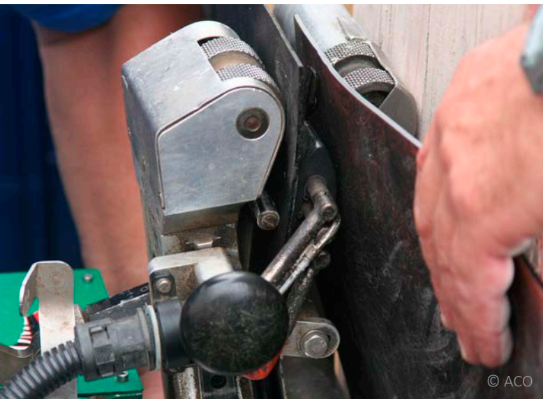
Flächenschweißnaht mit Prüfkanal