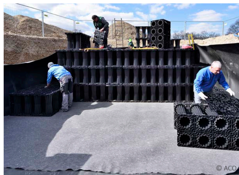
Europäische Schule München