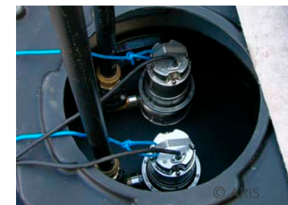
Integrierte Hebeanlage, AMD DD